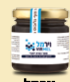
וירמל לחיזוק מערכת ההגנה של הגוף