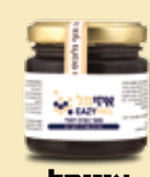
איזימל מרגיע, משפר את איכות השינה, ומוריד לחץ דם