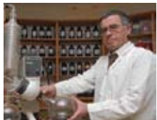
אחרי 18 שנות מחקר, תגלית של מעבדות צוף גלובוס: פי 6 ויותר יכולות ריפוי

בסופו של תהליך, הגיע צוות מדעני מעבדות צוף גלובוס לפריצת דרך עולמית, כשהצליח לפתח נוסחאות הזנה ייחודיות לדבורים – המתבססות על צמחי מרפא. כל מוצר, והנוסחה הייחודית שלו. כך, במקום שהדבורים ילקטו צוף ממקורות שונים ואקראיים, הדבורים המיוחסות בכוורת שבשירות מעבדות צוף גלובוס נזונות מתערובות ייעודיות של 'צוף' שהופק מצמחי מרפא. התוצאה: מוצרי כוורת בריאותיים שנותנים מענה אפקטיבי לשורה ארוכה של מצבים ותופעות בריאותיות.