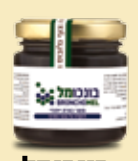
בונכומל להקלה על פגעי החורף