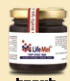
לייפמל משפר את תמונת הדם, משקם ומחזק את המערכת החיסונית שנפגעה בגין טיפול כימותרפי