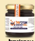
אנר'ימל להעצמת האנרגיה וחיזוק כושר ההתמודדות של הגוף